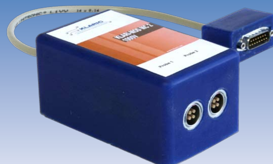
KLARI-MOD MC2 1000V, 2-kanalig