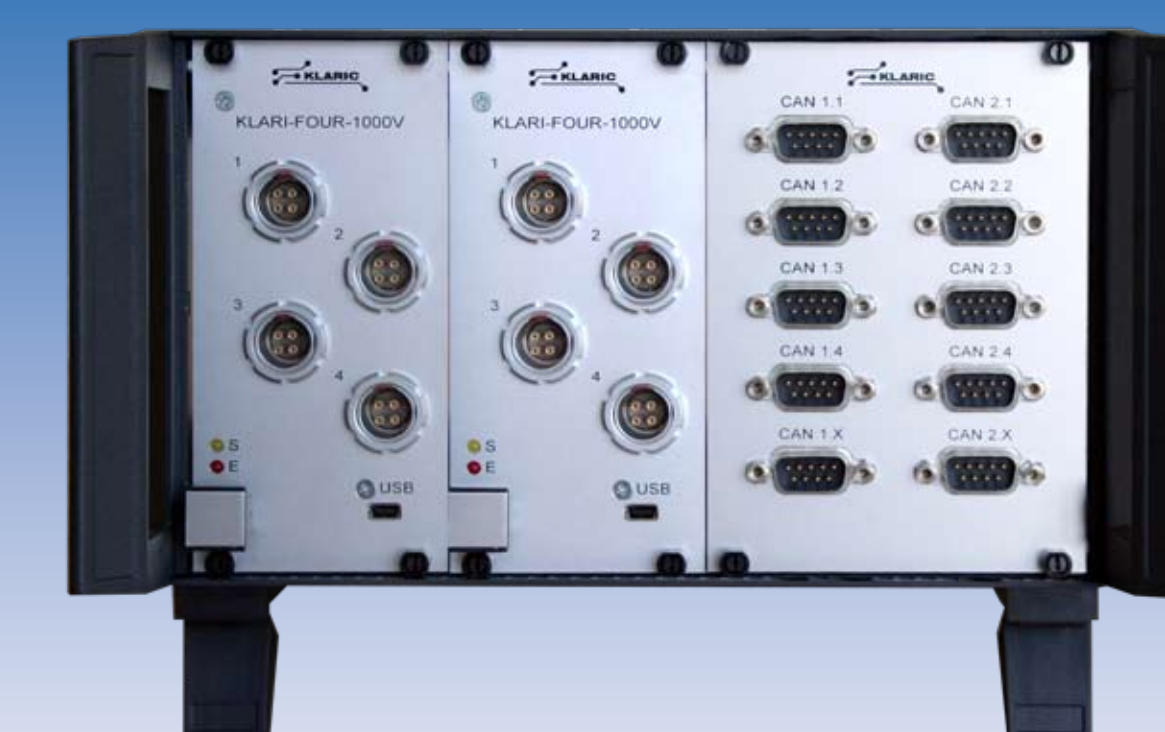
KLARI-FOUR 1000V, 4-kanalig